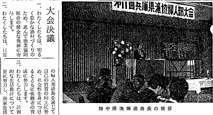
畑中県漁婦連会長の挨拶

わたくしたち漁村婦人は、恵まれない生活条件のもとにあつて、漁業生活の計画化、合理化と漁業生産力の発展向上に日夜努力を重ねてまいりました。このような努力の成果として、わたくしたちの生活水準は徐々に向上しつつありますが、一方わたくしたちの生業である沿岸漁業は、わが国漁業のめざましい発展にもかかわらず、いぜんとして低位生産に悩み、水質汚濁による漁場の荒廃、労働力の不足、輸入水産物の増加等の深刻な問題をかかえ、生活内容も他産業従事者に比べ依然低位にあるのが実情であります。このような現状において、わたくしたちは親組合に協力して、これらの諸問題の解決に努めますとともに、従来より実施してきた婦人活動をさらに充実することにより、漁業後継者の将来に夢と希望を与え、その責務の一端を果たしたいと思ひます。