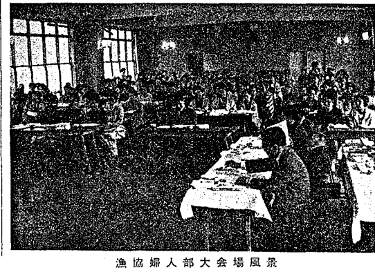
漁協婦人部大会場風景

一、わたくしたちは、明るく豊かな漁村づくりのため、進んで漁業協同組合の健全な発展に寄与します。二、わたくしたちは、日常の婦人部活動を通じて自己の資質の向上に努め、社会性を身につけるとともに後継者の育成に努力します。三、わたくしたちは、計画的な生活設計について更に努力し、漁業生活の改善に努力します。四、わたくしたちは、生活の合理化、科学化を図るため漁業担当の生活改良普及員の増員を要望します。五、わたくしたちは、漁協貯蓄推進活動に協力し、漁協貯蓄一〇〇〇億円の内達成に努めます。