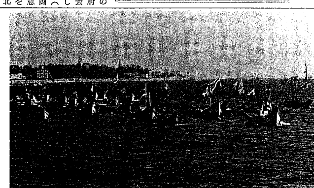
怒りと抗議の漁民パワーをぶつけた海上デモ

のり養殖の盛期も過ぎ、本県有史以来最高の生産が見込まれるようになったことは、まことに御同慶にたえません。昨年来、赤潮やPCBに悩まされた内海関係漁民にとって唯一の閉鎖関係漁民として、私達も心からうれしく存じております。さて、恒例によりまして、拓水の四月号には県の新年度予算、施策などについて、御報告することとなっておりますが、やはり数年来の公害問題を受けて、本年度は漁場環境の保全が最重点となっております。このことは、去る三月二十七日明石市民会館において瀬戸内海関係漁民による「公害絶滅」一五〇〇人結集に、御報告したとおり、現時点における我が国沿岸漁業を取りまく最重要課題であるからです。 例年のごとく、予算編成に当っては関係市町長、業界幹部の方々と格別別御支援助力をお願いした次第であります。水産課に計上された当初予算額が一〇億円を超えたのは、水産課は、御報告したとおり、