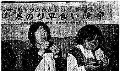
「のり」の展示販売等々