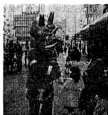
⑤のりの展販売等々 なお、当日の模様は、来たる二月二十三日(日)サンテレビ「のり」から海です」で放映予定されていますので、ぜひご覧下さい。