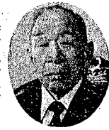
健康維持の工夫は (健康を維持する秘訣)

規則正しい生活をおくるとに尽きます。午前五時に起床し、体操し、朝食後朝風呂に入ります。これらを毎日欠かさず行っています。