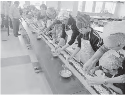
みんなで具材を乗せていきます

出来上がった9mの長い長い海苔巻きは、切り分けて参加親子皆さんで、お昼ごはんとしていただきます。 巻き寿司を口いっぱい頬張る子供や、笑顔で美味しそうに食べている姿を見ると、兵庫のりの魅力が参加親子に伝わったことが実感でき、幸せ