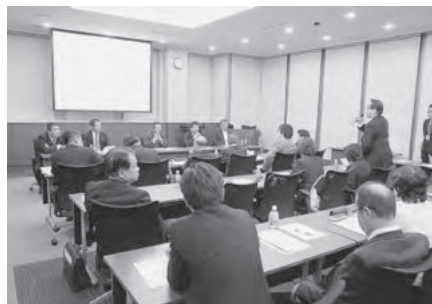
活発な意見交換の場となりました