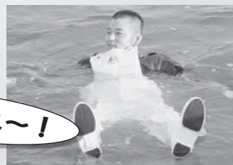
神戸海上保安部 海上保安官による実演

ライフジャケット・浮力合羽の購入は 所属JFか JF兵庫漁連資材部(078-942-9272) までお問い合わせください