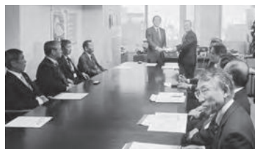
環境省小林水・大気環境局長に要請