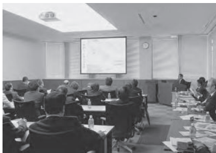
明石の漁業の現状を伝えました