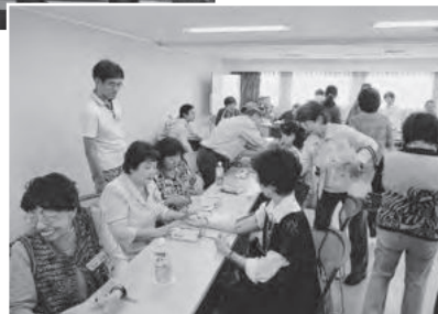
▲医療生協による健康チェック