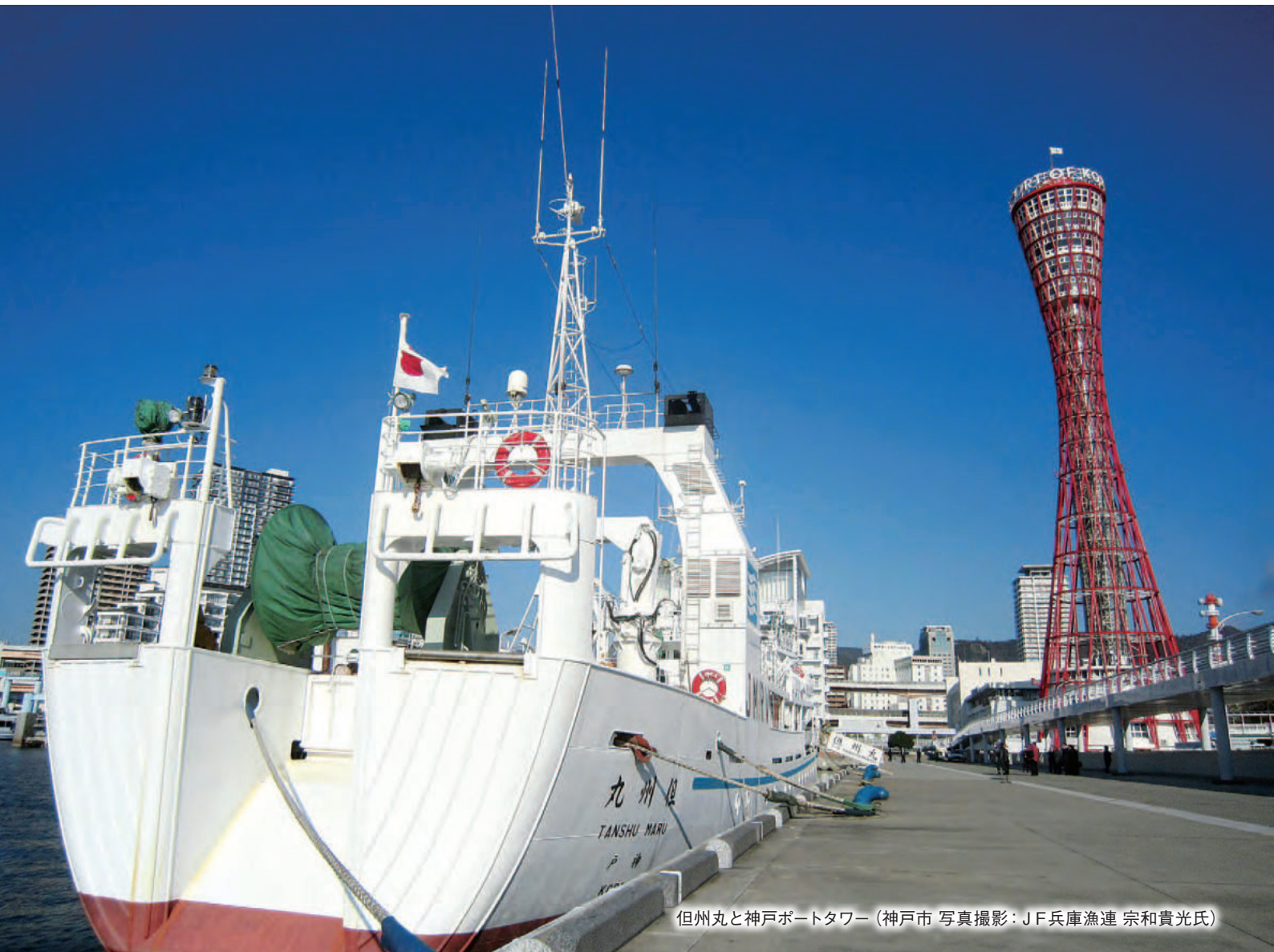
但州丸と神戸ポートタワー (神戸市)