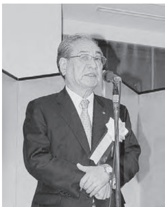
挨拶をおこなう岸会長

人々の手で豊かな海を築く。栽培漁業の取り組みは、本県に深い関わりがあります。（社）瀬戸内海栽培漁業協会は、我が国経済の急成長に伴い、重要な食料源である沿岸資源の再生産の場が荒廃し、疲