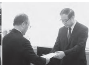
水産庁本川長官に要請