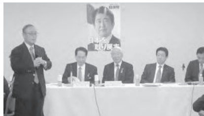
瀬戸内海再生議員連盟勉強会にて意見を述べる山田会長(写真左から、浜田香川県知事、井戸兵庫県知事、塩崎議長、末松(参)議員)

今後も、瀬戸内海関係漁連・漁協連絡会議では、瀬戸内海を豊かな海として再生するための法整備に向けて運動を継続していきます。