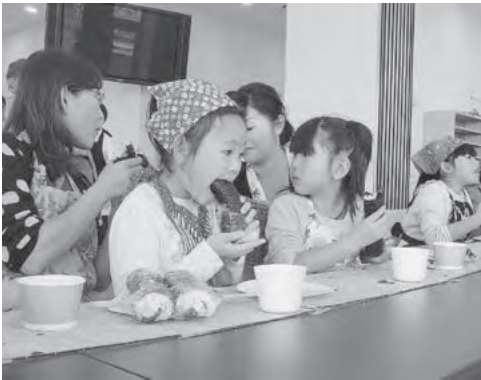
「兵庫のり」の美味しさを今後もPRしていきます

はじめに、参加者には、高級ノリ、業務用ノリ、および量販店で安価に購入できるノリと、3種類の味比べをしてもらい、「色」、「香り」、「食感」などノリの美味しさを実感してもらった後に、全長9mのジャンボ巻き寿司づくり挑戦しました。 長く敷きつめた巻き簾の上に、ノリ、酢飯、イカナゴのくぎ煮、玉子焼などの具を乗せて、芯がずれないように、「せーの」の一声とともに、みんなで息を合わせて慎重に巻いていきました。