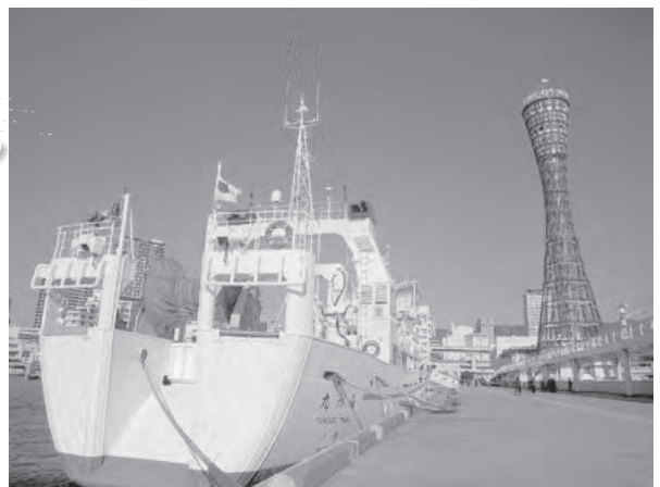
開業50周年を迎えた神戸ポートタワーと但州丸「長旅お疲れ様でした」

この後、但州丸は23日に神戸港を出港、25日に香住港に入港し、約40日間の実習を終えました。