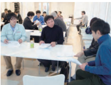
塾生同士で講義の内容を整理しました