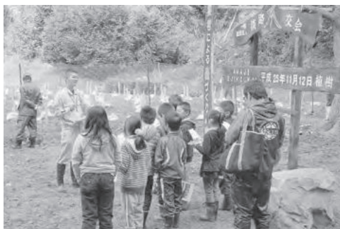
参加してくれた由良小学校の子ども達

当日集まったのはJF、行政、系統団体などからの約120名で、前田会長は開会挨拶で「植