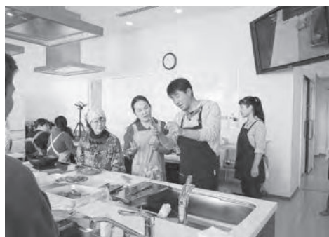
分かりやすい講習は好評でした

JF兵庫漁連では、シートクラブでの料理教室を通じて県内産水産物の魅力を伝える活動を行っています。只今、この活動にご協力いただけるJF・青壮年部・女性部の方を募集しているとのことです。興味のある方は、是非、シートクラブ（TEL：078-917-4137）までご連絡下さい。