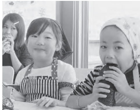
美味しく出来ました!

な気持ちになります。 兵庫のりの魅力と美味しいものを作る楽しさ、食べる楽しさを体験し、最後に、修了証書と初摘み海苔をお土産に持って帰っていただきました。 今後も兵庫海苔問屋協同組合とJF兵庫漁連は、兵庫のりの魅力をPRしていきます。