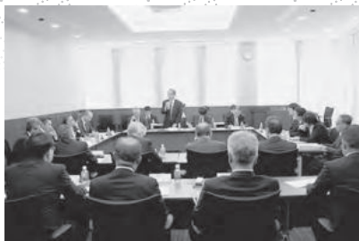
ワーキングチーム会議の様子

11月7日(木)、兵庫県水産会館において「瀬戸内海関係漁連・漁協連絡会議 平成25年度第3回ワーキングチーム会議」が開催されました。この会議は平成23年度から、瀬戸内海に面する10府県の漁連・県漁協が一堂に会し、瀬戸内海を豊かな海として再生するために話し合う場として継続して行われており、今回は、自民党国会議員で組織する「瀬戸内海再生議員連盟第5回勉強会」に向けて、各府県の取組事項と要望内容の確認や、環境省・水産庁に対して中央要請を行うことが決定されました。