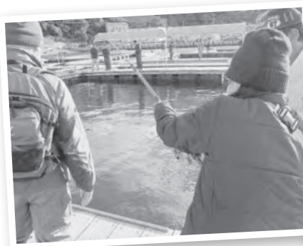
▲大きなカンパチが掛かりました！

担当職員らから指導を受けたのち、仕掛けを海中に入れると、すぐにウキにアタリが出て、皆、次々とマダイを釣り上げていました。また活きエサとしてアジをつけた人には大型のブリ、カンパチが掛かり、その強烈な引きに慌てながらも楽しんでいました。帰りは釣れなかった人にもマダイ1尾が渡され、楽しく学習会を終えることが出来ました。