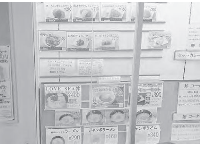
メニューに並ぶ「LOVE SEA丼」