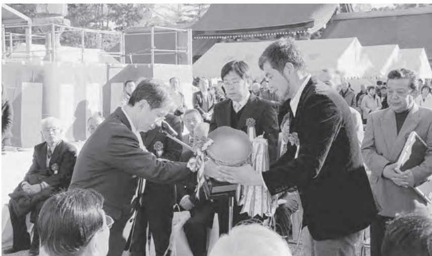
新平水産（右）の知事賞受賞の様子