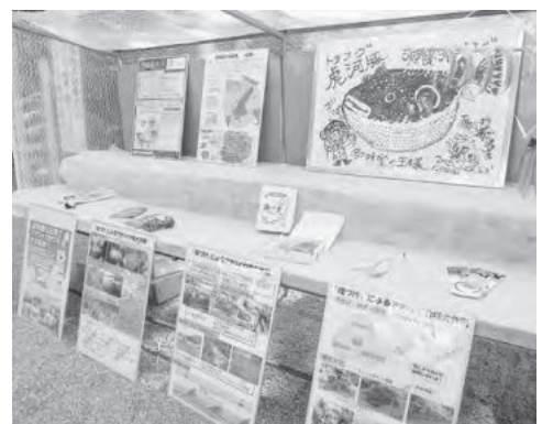
パネルを使った展示 さかなくんのイラストが目を引きます

また、会場では島内各地で生産された農林水産物の販売・展示が行われ、（一社）淡路水交会が水産物・加工品を販売したほか、「かいぼり」の活動や、島内での漁業の状況などがパネル展示され、訪れた人々は足を止めて見入っていました。他にも、平安時代から続く粥占祭が行われたほか、毎年恒例の淡路農漁業女性会による淡路の伝統料理「ちよぼ汁」も振るまわれ人気を集めました。