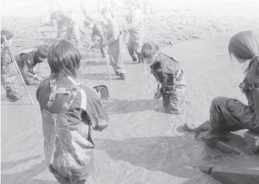
作業に参加してくれた龍谷大学の学生たち