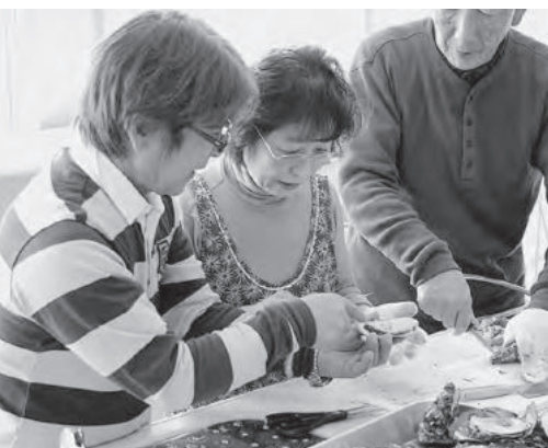
カキ剥き体験をしました

JF兵庫漁連では、シートクラブでの料理教室を通じて県内産水産物の魅力を伝える活動を行っており、この活動にご協力いただけるJF・青壮年部・女性部の方を募集しています。興味のある方は、JF兵庫漁連シートクラブ（TEL：078-917-4137）までご連絡下さい。