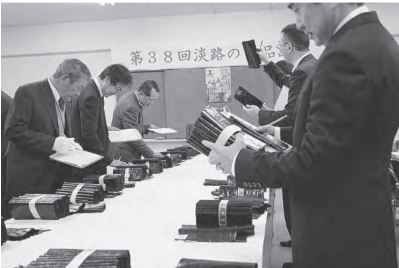
良質の淡路のりが並びました