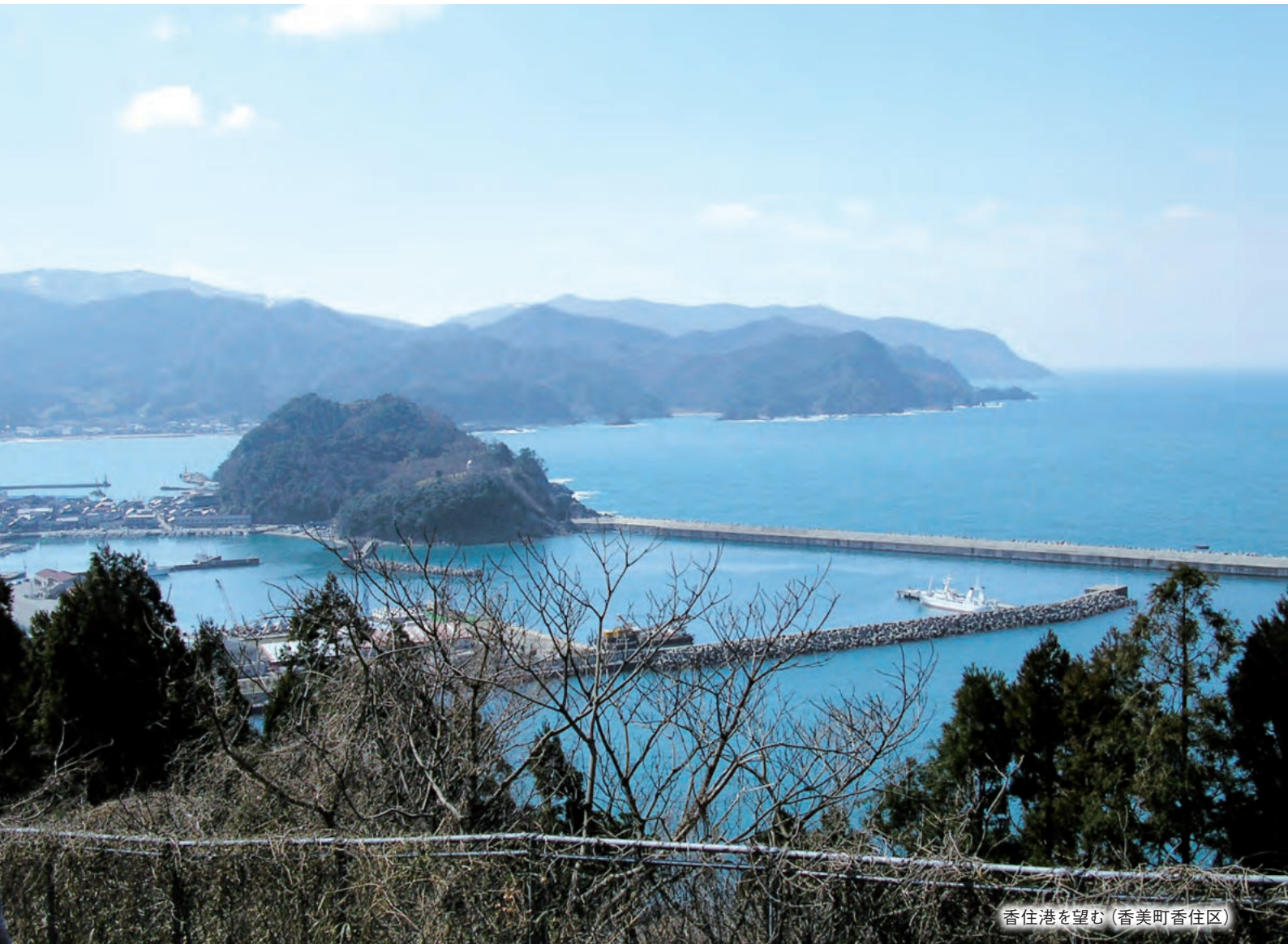
香住港を望む (香美町香住区)