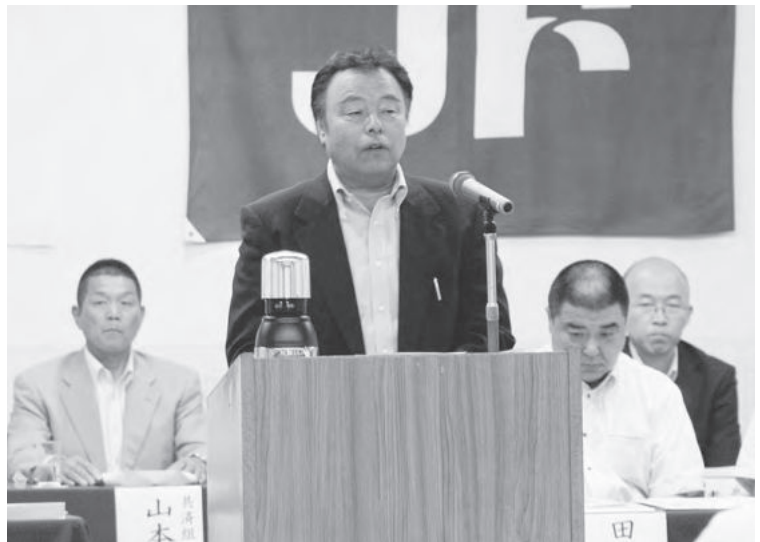
兵庫県漁業共済組合 川越組合長理事

ぶらす・安心経営！」とした3ヶ年全国運動の最終年度として、漁業収入安定対策事業の「積立ぶらす」を活用した加入推進に取り組んだところ、計画には若干届かなかったものの、前年を上回る実績を上げることが出来た。これは制度内容への理解が深められたことや県・市町からの掛金助成等の効果が十分に発揮された結果だ」と謝意を表され、今後未加入の漁協・漁業種類への利用拡大