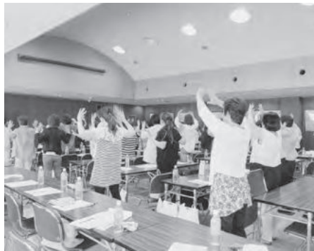
ストレッチでリフレッシュしました！

総会のあと、NPO法人あつたか演劇研究会によ る「創造力をもっと豊かに！心と体のストレッチ 」と題した研修があり、講話のほか歌を聴いたり楽し く身体を動かし、心身ともにリフレッシュしまし た。心と体の健康を維持するために、豊かな食生活 が基本となることを再認識した部員たちは、今後の 魚食普及活動に、さらに自信を持って臨もうと決意 を新たにしました。