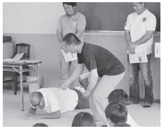
タコが疑似餌に飛び付く場面を再現!

タコに関する話をしました。同市によると7月中旬に再度、「明石だこ」を使用した料理を給食に出すとのこと。これまで半夏生を盛り上げる取り組みは各商店街などが自主的に行ってききましたが、今年は8団体が連携し、市内各地で様々なイベントを催しました。JR明石駅前での「タコの天ぷら」