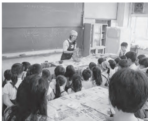
シートクラブの食育教室は明石市内各小学校で開催される