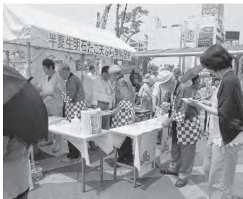
長蛇の列となったタコ料理の振る舞い

タコに関する話をしました。同市によると7月中旬に再度、「明石だこ」を使用した料理を給食に出すとのこと。これまで半夏生を盛り上げる取り組みは各商店街などが自主的に行ってききましたが、今年は8団体が連携し、市内各地で様々なイベントを催しました。JR明石駅前での「タコの天ぷら」