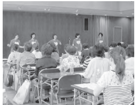
NPO法人あつたか演劇研究会の講演