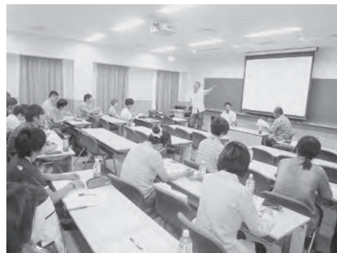
大角氏の講演の様子

7月8～10日の3日間、関西学院大学生協で「LOVE SEA丼」第4弾が発売されました。