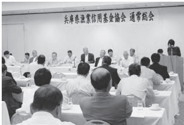
基金協会総会の様子