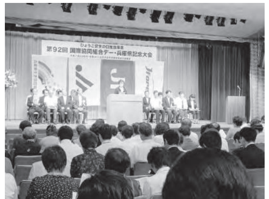
森会長のJCC宣言は満場一致の拍手をもって採択