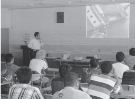
「生き抜く」ための注意点について理解を深めた

「生き抜く」ための注意点について理解を深めた。①生き抜く強い意志、②体温低下防止のための厚着とライフジャケットの着用、③通信手段の確保の3点が強調されました。会場を移して行われた実技訓練では、自動膨張式の救命いかだを実際に海中に投下し乗り込む訓練や、救命いかだ内の機材説明、実際に発煙筒や落下傘式発煙筒を使用する訓練、さらにはJF兵庫漁連によるライフジャケットの実習体験などが行われ、参加者は万が一の時に備えて真剣に耳を傾けていました。