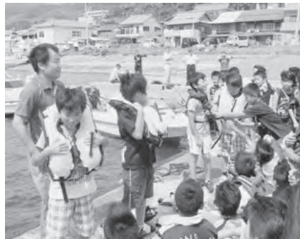
作動体験はびっくりしたようです