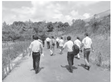
果樹園を見学(県立農林水産技術総合センター)