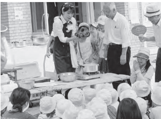
茹であがったタコに喜ぶ園児ら

園児・保護者、関係者 ら約130名が集まり 行われました。講師は シートクラブの森さん、川端さんが務 め、園児らに分かりやすくタコの生 態などを伝えました。また、タコが立っ て歩く姿を初めて見た園児らは大喜び で、じっと観察する姿も見受けられま した。最後に、教員らによる「茹でダ コづくり」があり、全員で試食して、 園児も教員も楽しんだ教室となりました。 今後イエス団の運営する各園で同 様の教室を開催する予定です。