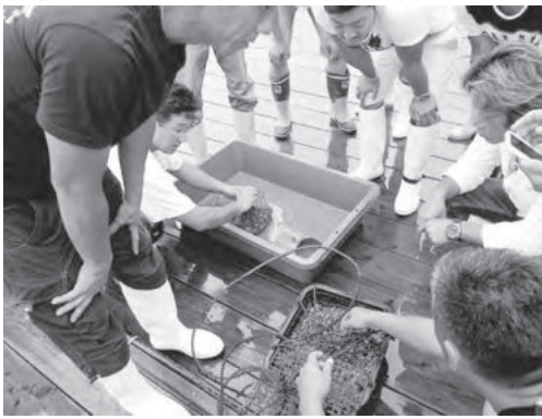
アサリの天然採苗および垂下式養殖の説明

天然採苗の方法は、袋網に砂利とケアシエルを詰めて、砂浜に設置し、半年〜1年後には約2cmのアサリの稚貝を収穫するというものです。稚貝を収穫し終えた袋網は、再度設置して使用する事ができ、流失しない