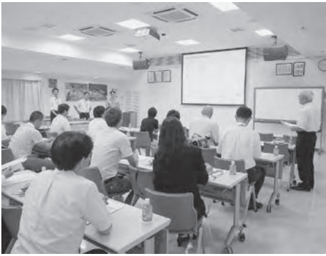
古野電気(株)三木工場での研修

翌日は、まず兵庫県立農林水産技術総合センター(加西市)を訪れました。講義では「コウノトリ農法」などの環境創造型水稻栽培と、酒米「山田錦」の現状と取り組みについて学んだほか、敷地内の果樹園に出て、地球温暖化に対応した果樹栽培について学びました。最