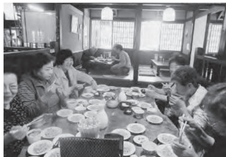
出来立てをすすりこむ!