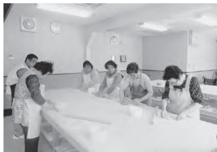
そば打ちを楽しみました

食べ終わったあとは「出石城下町散策」班と「温泉」班に分かれて、それぞれに出石を楽しみました。「またこんなことしたいね」「次はうどんもいね」など、充実した一日を過ごしました。