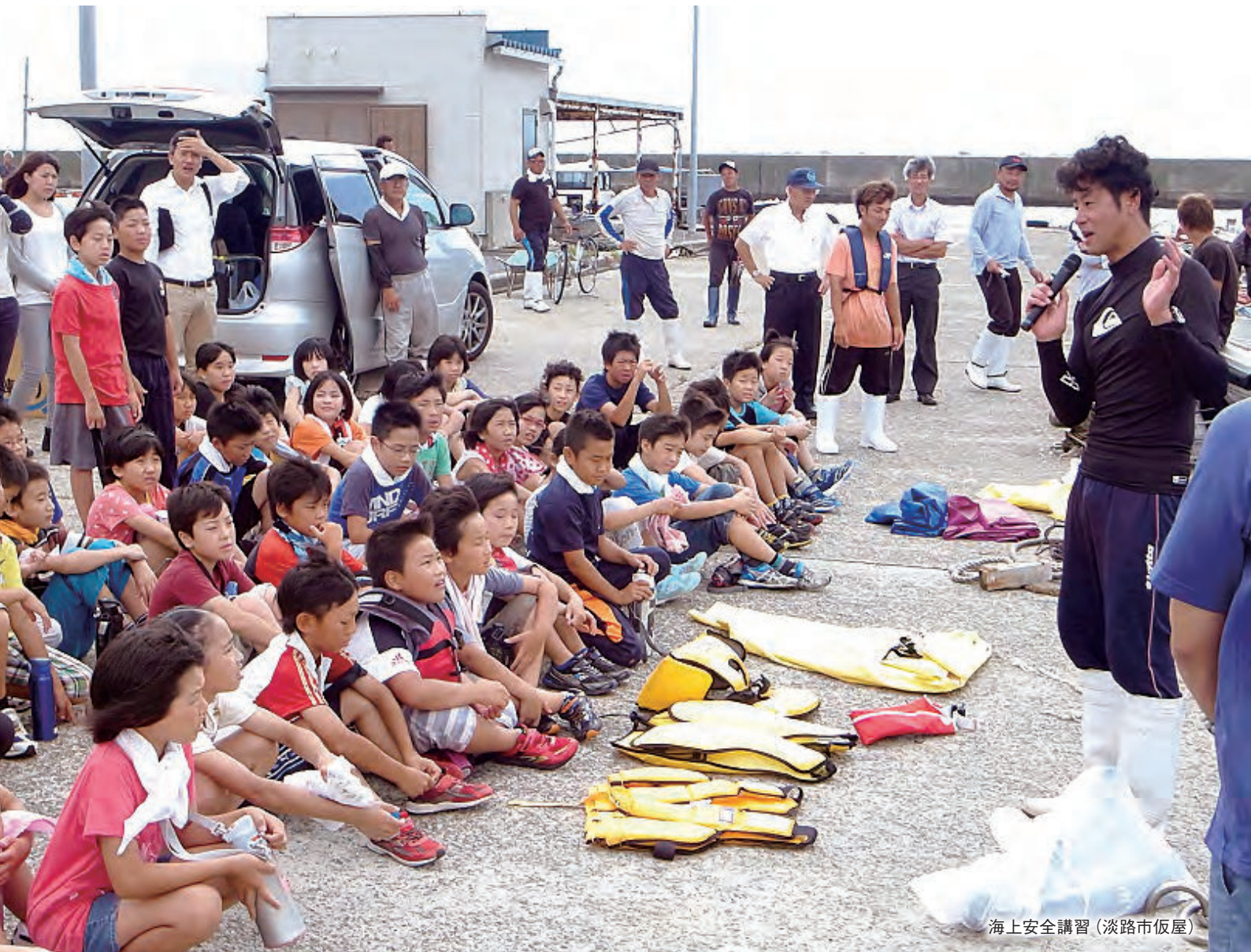
海上安全講習 (淡路市仮屋)