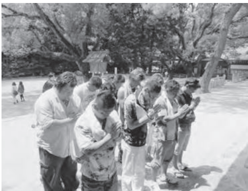
熱田神宮を参拝しました

限り5〜6年ほどは繰り返し使用できます。また垂下式養殖は、コンテナの中に砂利とケアシエルを敷き詰めて、その中にアサリ稚貝を入れて行っていました。養殖されているアサリは4cmを越えたものが多く、大きいものは約5cmの大きさでした。兵庫県下の漁協も視察に訪れており、帰ってから自身の浜でも同じように天然採苗ができたとの話も聞くことができました。参加者からは「淡路島は波浪が強いので、袋網が流される可能性もあるが、同じように挑戦してみたい」との意見がありました。熱田神宮では、豊漁と海上安全祈願を行いました。