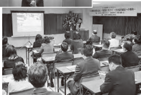
消費者としてのあり方についてご講演いただきました