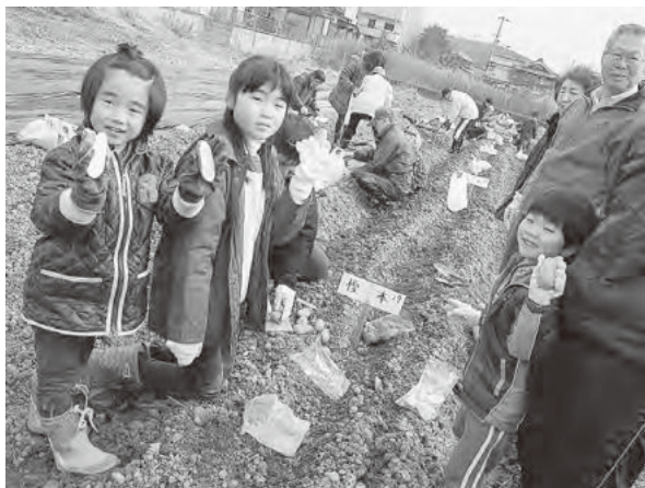
植え付けに気合いを入れる参加者

また、この様子はJA全中が作成するインフォーマーシャル（情報発信に重点を置いた広報）として食農教育をテーマに撮影が行われました。インフォーマーシャルは3月中旬の「アグリンの家」CM枠で放送される予定で、その他にもJAグループのイメージアップに活用される予定です。