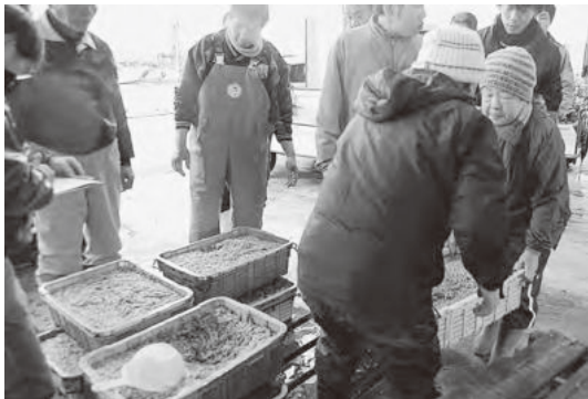
明石浦漁港の水揚げの様子

今漁期のイカナゴ漁は2月26日(木)に解禁しました。 兵庫県立水産技術センターでは、今年のイカナゴ漁獲量を「産卵量が少なく過去最低レベル」と予測するなかでの解禁となりました。県内の水揚げ状況は、天候・潮が悪く、やや少なめか平年並みであった一方、サイズは35ミリ前後と生育状況は良く、消費者がくぎ煮を炊くのにも適当な大きさまで成長してしました。明石市の魚の棚商店街では、早速イカナゴを買い求める消費者の姿が見られるなど、漁業者も消費者も待ちわびた解禁となりました。