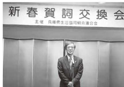
◀挨拶される 金澤和夫 兵庫県副知事

また、トップセミナーに引き続き、金澤和夫副知事のあいさつと乾杯で賀詞交歓会がスタート。会員生協・団体の皆様、それぞれに賀詞交換を通じて交流を深めました。