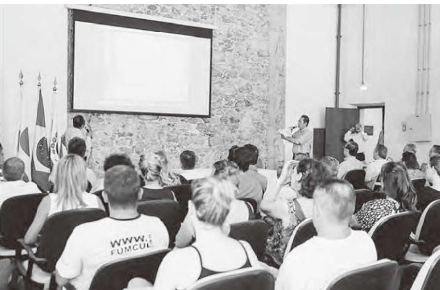
◀パラナグア市での説明会の様子

クリチバとパラナグアで開催しました。原料の乾しノリを輸出し、JF兵庫漁連が加工技術面で協力する現地工場で焼きたての製品に仕上げることで、ブラジルでの小売価格を抑え、他国の海苔に対する競争力をつけることもに焼きたての美味しさをアピールするのが狙いです。 このたびの調査では、同国での日本食ブームがさらに拡大し、ブラジル国内では予想の2倍にあたる約3億枚（推定）の海苔が消費されていることも判り、今後への期待が膨らんでいます。