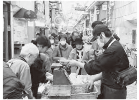
魚の棚商店街はイカナゴを買い求める客で賑わった

さまで成長してしました。明石市の魚の棚商店街では、早速イカナゴを買い求める消費者の姿が見られるなど、漁業者も消費者も待ちわびた解禁となりました。