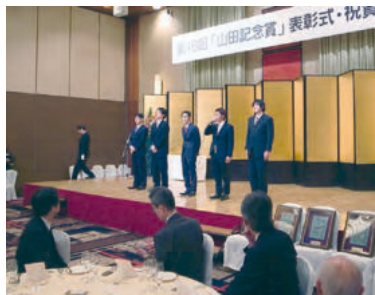
山田記念賞で抱負を述べる10期生の皆さん

他に5日開催の第18回山田記念賞で10期生5名が紹介を受けて会場の皆さんに抱負を述べたり、「平成26年度瀬戸内海環境保全協会賛助会員研修会」、平成26年度淡路地区漁業士による座談会」が認証講座として開講されたりと学ぶ機会に恵まれたり積極的な参加がありました。