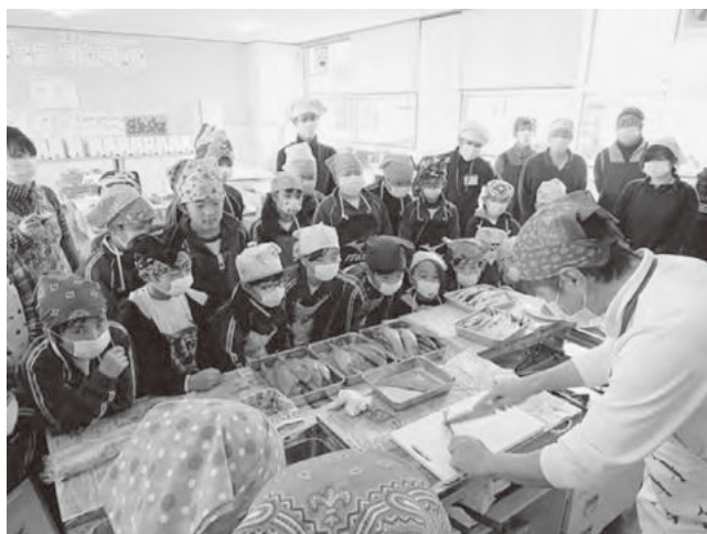
皆さん、マスクにバンダナが良く似合っています