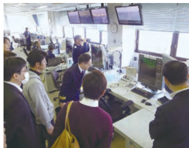
レーダーの画像について説明を受ける