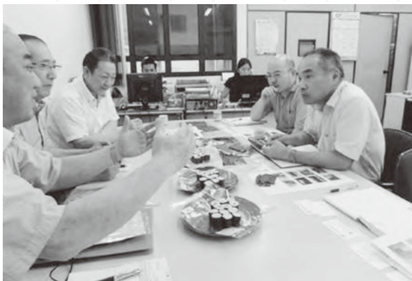
現地商社は強い関心を示しています

南米最大の国、ブラジル連邦共和国（以下ブラジル）は日系人が多く、味噌・醤油などの日本食材が普及しているほか、日本料理レストランや手巻き寿司のファストフードチェーン店も数多くあり、ブラジル国内で消費される海苔（全形）は推計1億5,000万枚とされています。また、同国パラナ州は兵庫と姉妹提携を結んでおり、県民交流団の派遣など人的交流が盛んなところです。