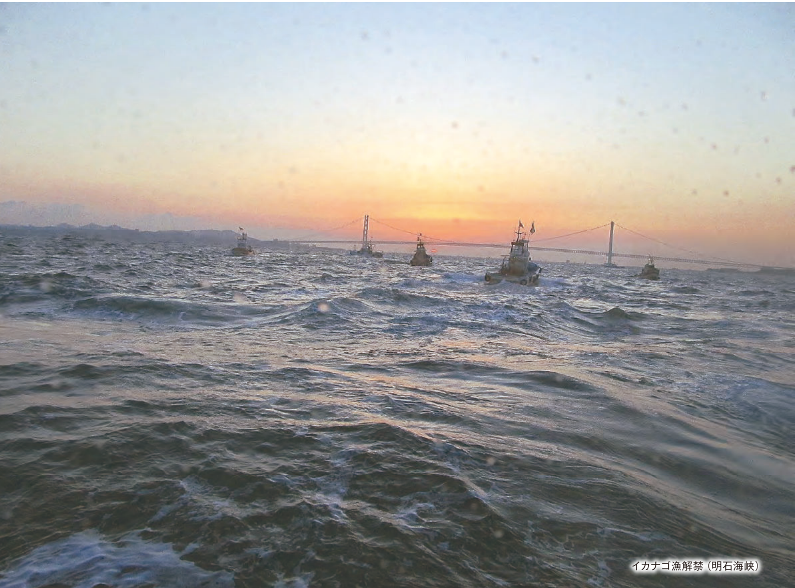
イカナゴ漁解禁 (明石海峡)