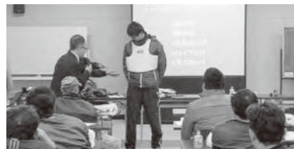
様々なライフジャケットを紹介

今後、当地区で「組合員のライフジャケット100%着用」を目指すことに賛同が得られ、講習会を終了しました。