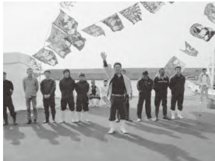
力強い宣誓を行った福島部長