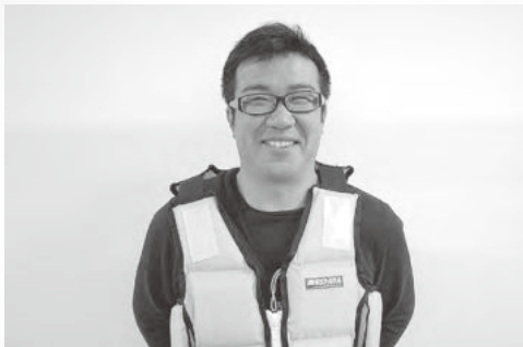
固型式ライフジャケット

ライフジャケットは金具を調整し、体に合ったサイズで着用しましょう。固型式ライフジャケットには、薄くて軽いものもあります。是非、お試し下さい!