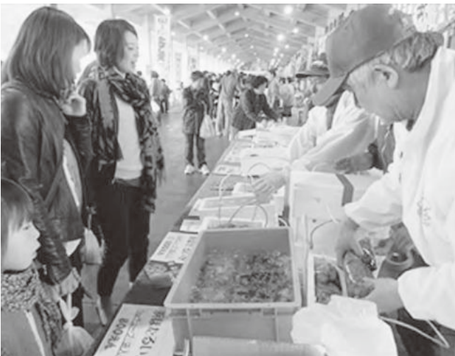
浜ほたるは今年も人気でした！