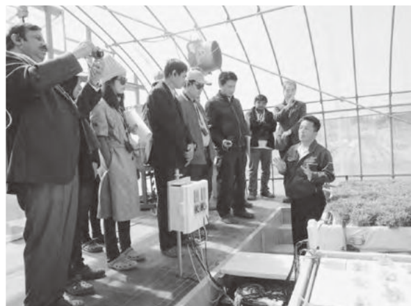
JA兵庫南出資法人(株)ふぁーみんサポート東はりまで水耕栽培施設を視察するアジア諸国の研修生

農業現地研修として、25日はJA淡路日の出管内で野菜及び花きの農家を、また26日はJA兵庫南管内でJA出資法人と6次産業化に取り組む女性グループを視察しました。