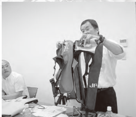
新しく発売されたライフジャケットも紹介されました

今年度も県内の各地区のJFへ出向いて、講習を行っていきま すので、ご希望のあるJFは、是非、下記連絡先までお電話くだ さい。