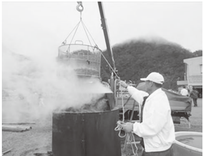
クレーンで吊る釜揚げほたるいか