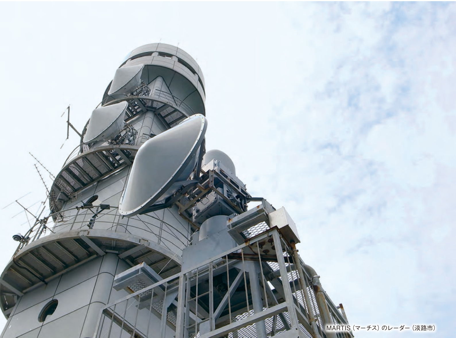
MARTIS (マーチス) のレーダー (淡路市)