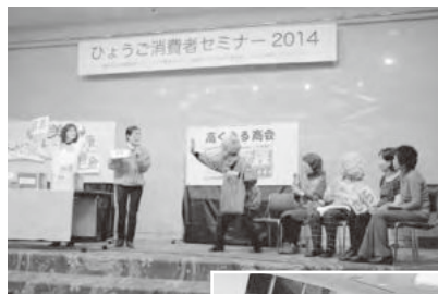
◀会場は笑いに包まれ楽しく学びました

質疑応答も活発に行われ、参加者からは「契約書を盾に、損害賠償や返金に応じない企業に対して、泣き寝入りしなくても良い場合もあるということが分かりました」「ジェネリックや医薬品についての情報もあって良かった」「理解しているつもりでも、情報に流されることも多い毎日。気をつけたいと思いました」「健康食品もいいかもかもしれませんが、食べ物でしっかり食生活を管理することが大切と感じました」などの感想が寄せられ、充実したセミナーとなりました。