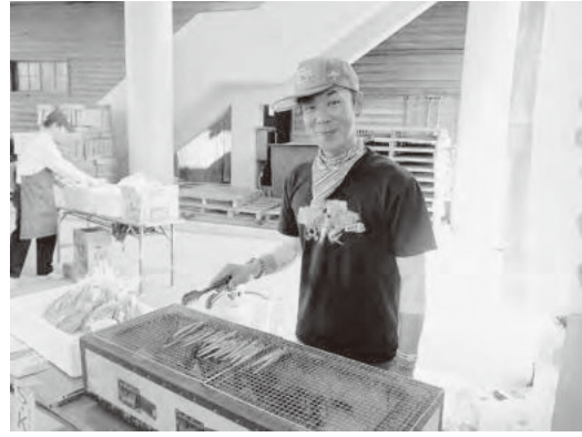
干しニギスを使ったS・K・Sも好評でした