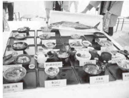
様々な生サワラ丼が並びました

今年度の播磨灘でのサワラ流網漁が4月24日(金)にはじまり、翌日には生サワラ丼の販売が再開されることから、24日午後、鳥飼漁港において