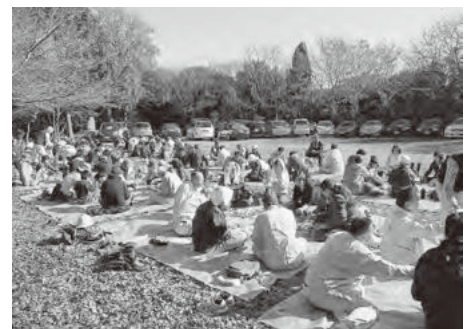
快晴のもと、皆で昼食を摂りました