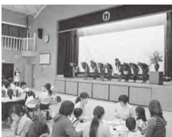
女性部から歌の披露がありました