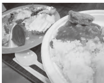
シーフードカレーのほか、沢山のおかずが出来ました