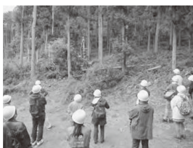
重機を使った作業を見学

午後には朝来市森林組合が管理する山に入り、木の伐採作業を見学しました。樹齢約30～50年の杉を手際の良い作業で狙った方向に倒すと見学者から大きな拍手が上がりました。このほか作業用機械の操作も見ることが出来、参加者は盛んにカメラに収めたりしていました。 若い就業が増えてきたことや、機械化が進み効率化が図られていること、間伐材の有効利用など、今後の林業の姿を垣間見ることが出来た研修となりました。