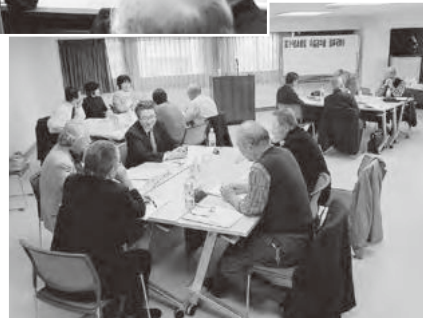
▶グループディスカッションでは、それぞれの監査状況を共有しました