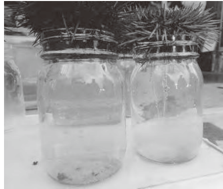
瓶の上に置き、精子・卵子を取り出します