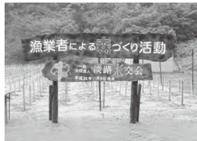
順調に成長し豊かな森となることを願います