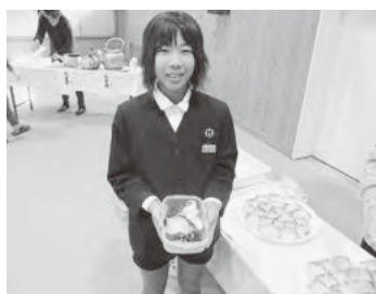
地元産食材の給食が出来ました

室津小学校と同女性部が始めたこの会は、回を重ね、児童だけでなく地域の皆さんにも室津地区の地産地消や文化などを知ってもらえる行事として大きな役割を担っています。今後も地域の方々の協力を得て続けられていくことを期待します。