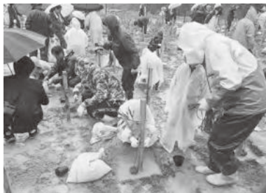
雨の中の作業となりました