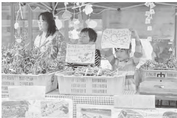
自分たちで育てた黒大豆枝豆を元気に販売する子どもたち