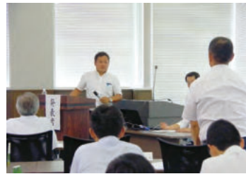
質問を受ける塾生