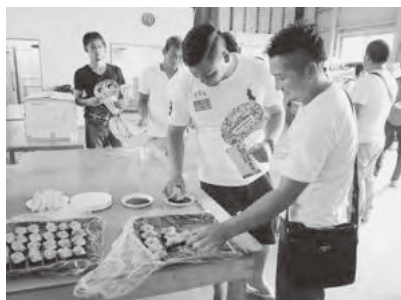
冷凍シラス軍艦巻き試食