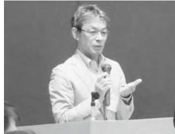
中西講師（JF兵庫漁連環境アドバイザー）の講演の様子