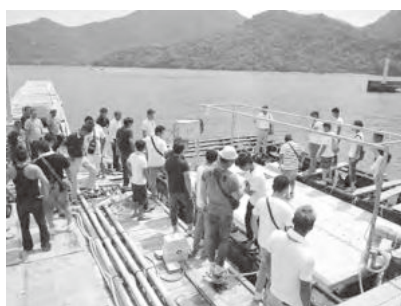
二枚貝海面育成装置