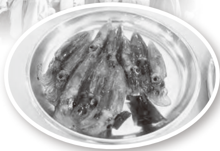
ホタルイカしゃぶしゃぶ

会場では、カゴに入ったホタルイカをクレーンでつり上げ大釜でゆでた4,000人分の無料試食が振るまわれたほか、獲れたて船上仕込みの沖漬け、軍艦巻き、串揚げ、炊き込みご飯、しゃぶしゃぶなど様々なホタルイカ料理が提供され、販売ブースには長い行列が出来ました。また、制限時間内に食べた数を競う「全日本わんこほたる選手権」では熱戦が繰り広げられ、会場を盛り上げました。(文：JF浜坂)