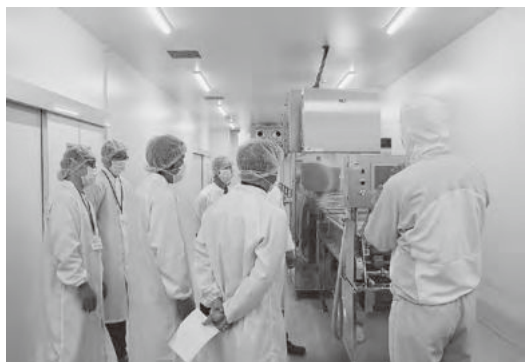
のり加工センター 連続火入機の説明

塾生は、両加工センター入場時の手洗い、エアリーシャワーによる埃等の異物除去等の衛生管理の取組に驚くとともに、加工原料や鮮魚の取り扱い、加工される海苔等級や味付け工程など、様々な意見交換が行われました。