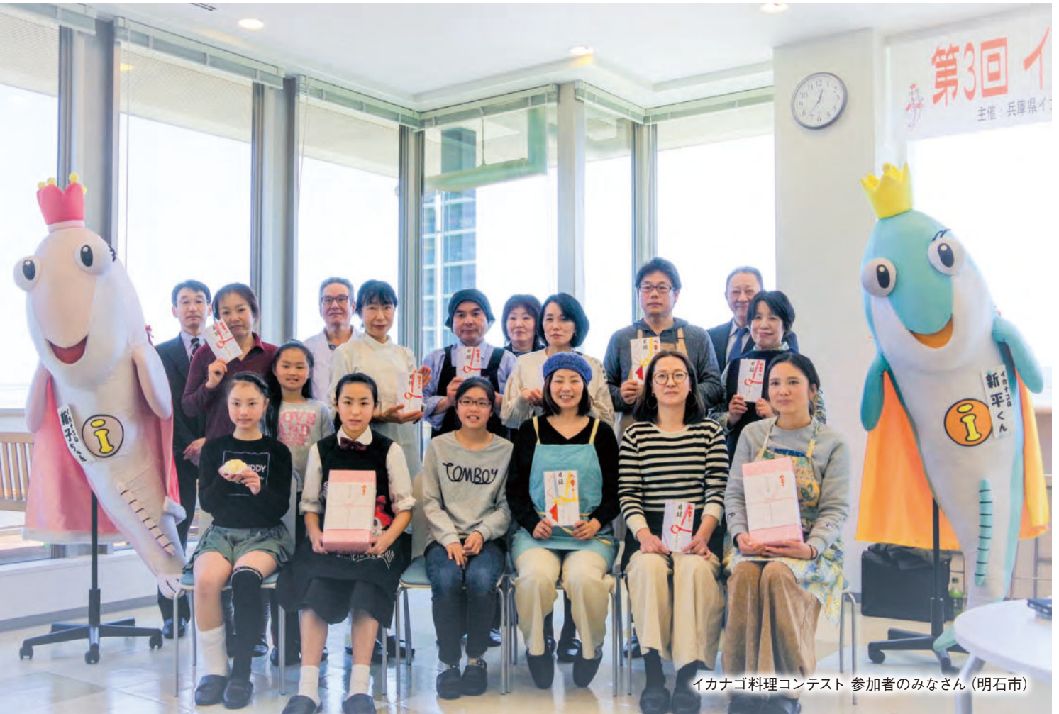
イカナゴ料理コンテスト 参加者のみなさん (明石市)