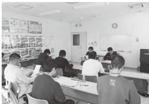
水産加工センターでの講義