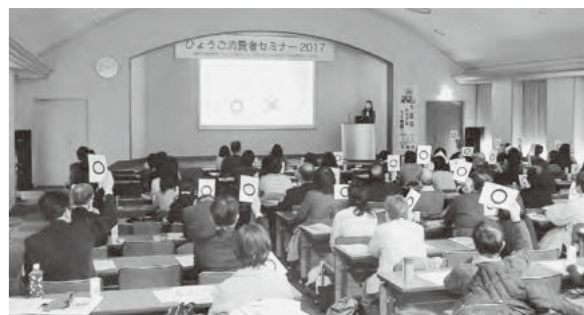
〇×クイズでわかる!適格消費者団体