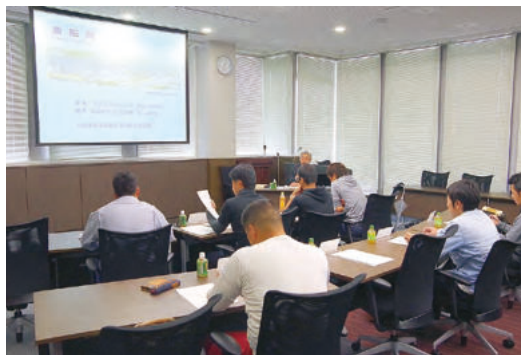
漁船保険概要の講義