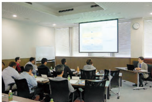
栄養塩環境と漁業の講義