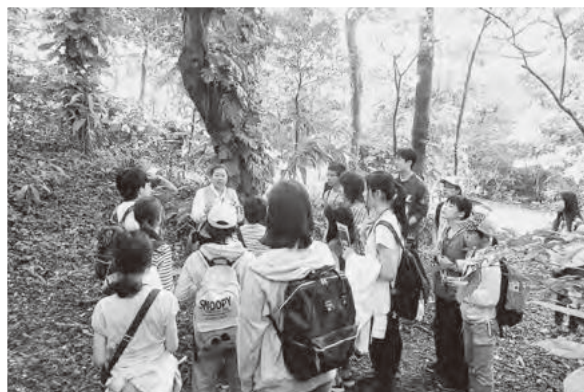
旧日本軍の司令部跡で話を聞く参加者

※「平和のカンパ」組合員などで構成される「平和企画の会」が毎年8月に、組合員にカンパの呼びかけを行っています。カンパ金の使途についても会で検討し、虹っ子スタディツアーやピースアクションなどに助成を行っています。