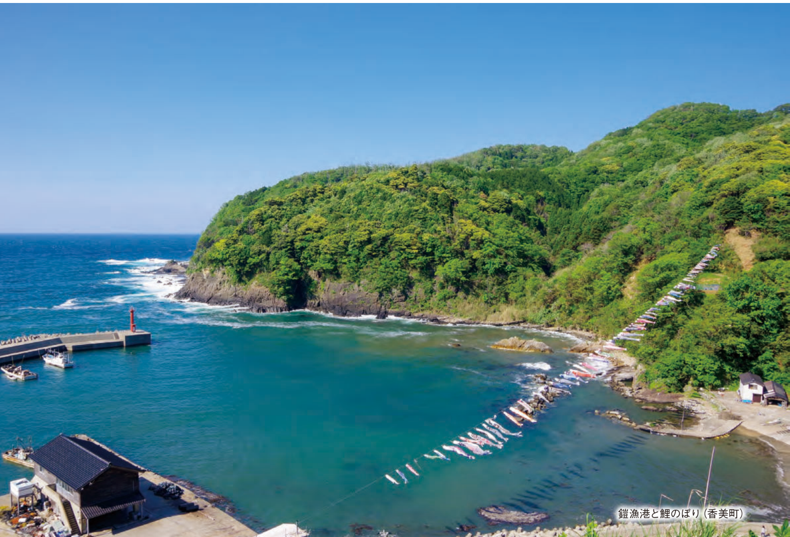
錨漁港と鯉のぼり (香美町)