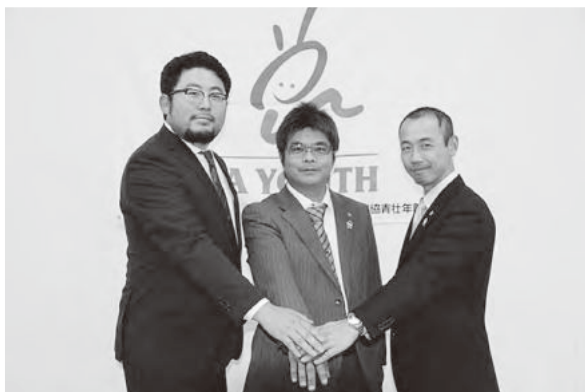
地域に根ざした活動に力を合わせて取り組むことを誓う県青協の役員

平成30年度は、JA青壮年部の地域活動を活性化するとともに、大学生や消費者との交流や新規就農者への支援など、組織の力を合わせて新たな活動にもチャレンジする予定です。