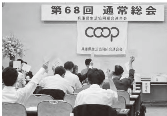
すべての議案が可決されました