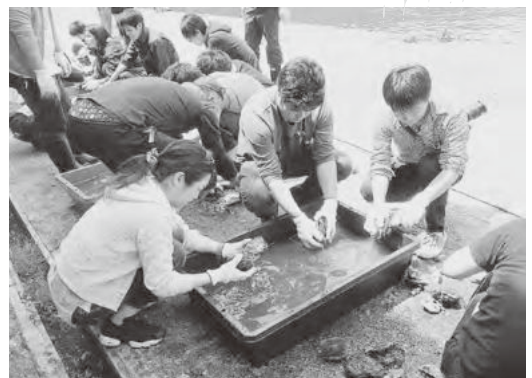
収穫した岩ガキを掃除

その後、希望者の方に船に乗って頂き、養殖場で岩ガキの引き揚げを行い、それを港岸壁まで持ち帰り、皆で大きな塊になっている岩ガキを道具を使いひとつずつバラバラに分