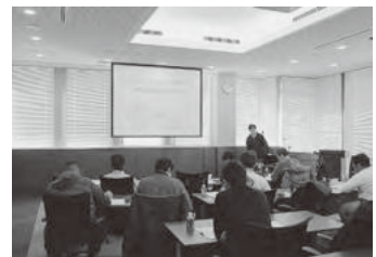
水産会館での講義の様子