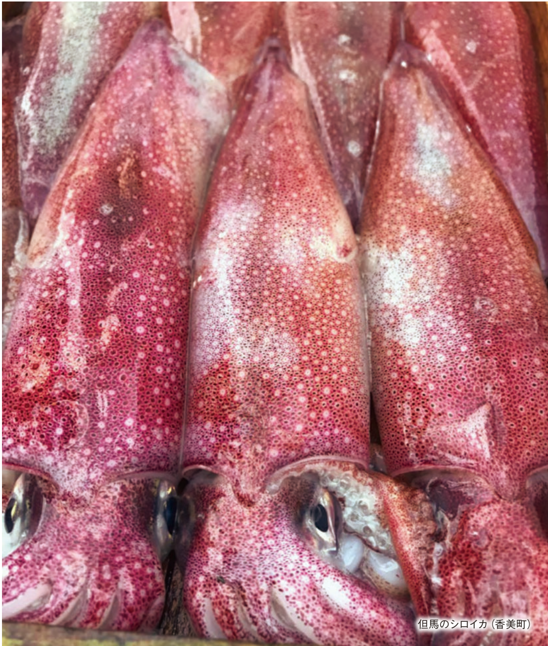
但馬のシロイカ (香美町)