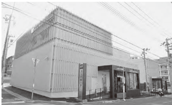
ファーマーズマーケット、支店とキッチンが並ぶ御影JA総合センター

マルシェとキッチンが相乗効果を発揮し、都市部においてもJA総合事業としての機能を高めていくことを目指しています。