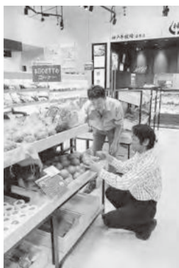
◀選りすぐりの農畜産物が並ぶ マチマルシェ御影