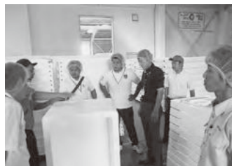
視察研修 大西コルク工場見学 (H29.8)

大輪田塾では、現在、今秋入塾される第14期生を募集しています。皆様のご応募をお待ちしております。