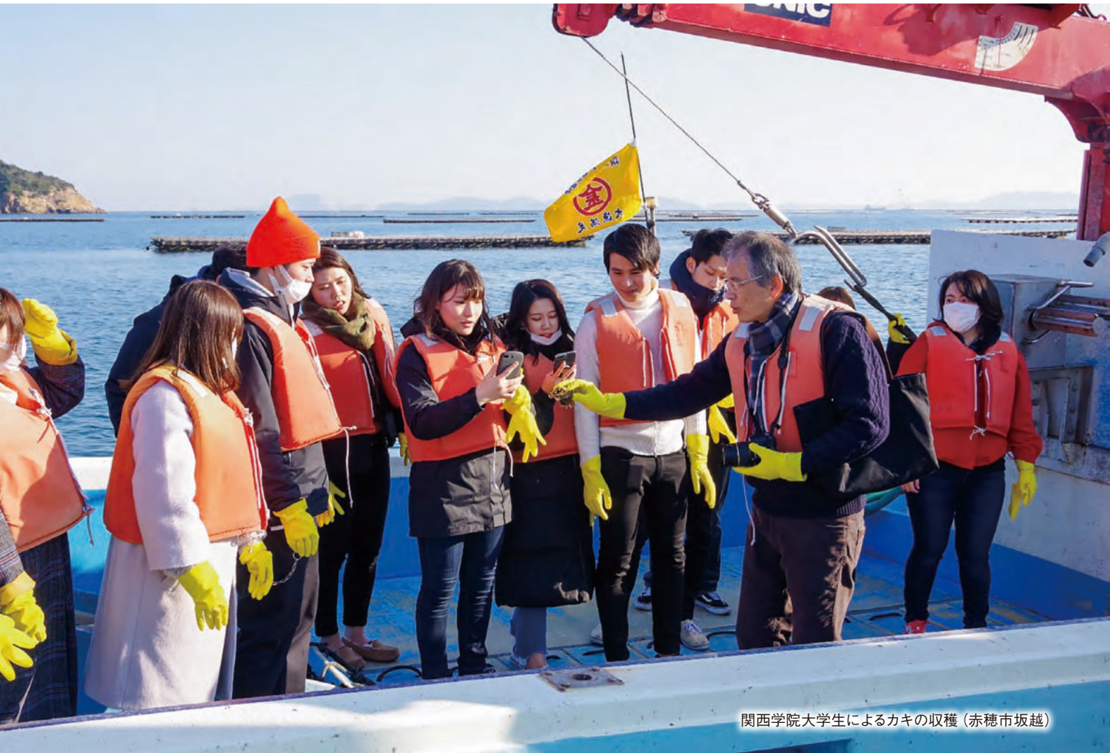
関西学院大学生によるカキの収穫 (赤穂市坂越)