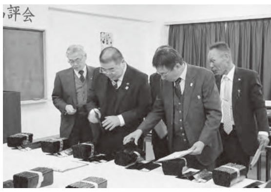
どのノリも品質は良く、難しい審査となりました

務所の関係者ら10名の審査員が、応募のあった72点の中から第一次審査で選ばれた50点を対象に、色・艶・風格・味などを基準に審査を行いました。良い出来栄えのノリが出揃ったため、会場では審査員らが頭を悩ませていました。 審査の結果、選ばれた優秀品24点(別表参照)のうち、最上位の兵庫県知事賞は大草水産(JF森)が受賞しました。 なお、今回も出品されたノリはすべて味付け加工して、福祉施設等に無料配布されます。