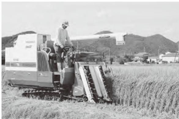
31年産はさらなる拡大を目指しています

さらに、JAは「旬彩蔵」で試食イベントを開くなど、積極的にPRを行い、31年産は25ヘクタールの栽培を計画しています。