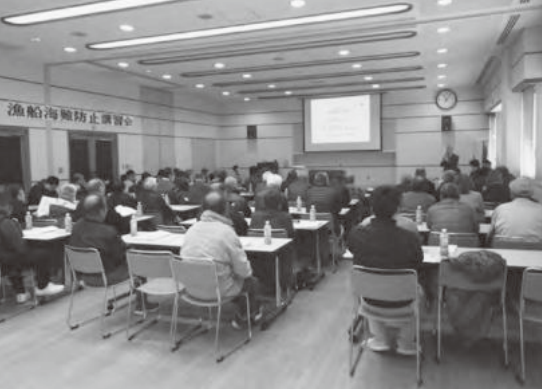
漁船海難防止講習会

人工呼吸の実演を行いました。大型船ブリッジを忠実に再現したシミュレーター講習では、神戸沖から明石海峡大橋を通過するまでを体験し、昨年末に濃霧時における死亡海難事故があったことから、濃霧時における大型船と漁船の見え方を双方の視点に切り替えて確認しました。大型船からは漁船が確認しにくいことを体験し、「これでは漁船は全く見えない」「漁船からは見えていても大型船からは見えていないことが分かった。今後は気を付けたい。」などと声が上がりました。 また、大型船の前を横切る漁船が船の前方で死角に入ったところで、大型船・漁船の双方の視点に画面を切り替えて距離感の違いも体験し、大型船側から見た光景との差に驚いたよう漁業者は、「このくらいの距離まで接近することはある。大型船からは周りが見えにくい事がわかった。」と話し、安全航行について再確認したようです。