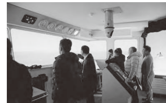
シミュレーター体験を行う参加者

国土交通省神戸運輸監理部、独立行政法人海技教育機構海技大学校（芦屋市）が主催する安全運航講習会は、平成22年から毎年、イカナゴ漁期前のこの時期に安全運航の意識を高めてもらうと開催されています。9回目となる今年は、1月22日（火）同大学校内で開催され、明石海峡付近で操業するJ