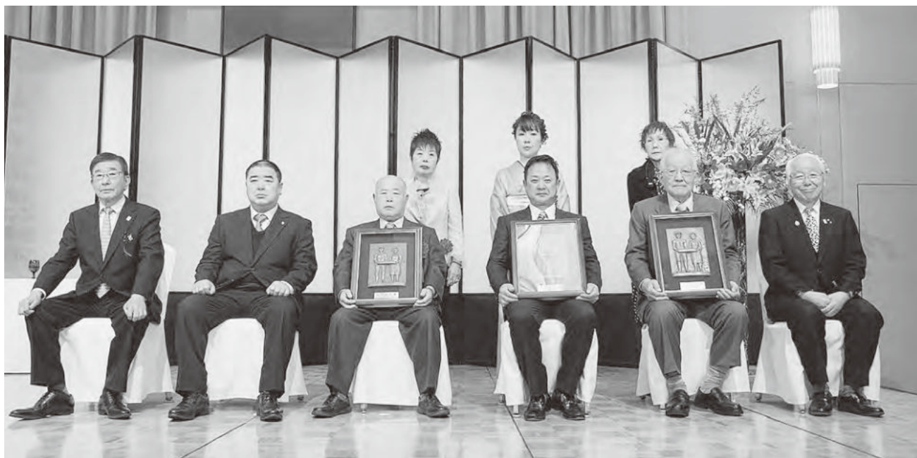
【山田記念賞受賞者】左から、東根理事長、田沼会長、中谷ご夫妻様、中尾ご夫妻様、西村ご夫妻様、井戸知事