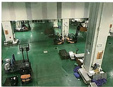
豊洲市場マグロのセリ場

本年度の大輪田塾現地視察研修は8月6(火)〜7日(水)に、塾生をはじめ計15名の参加で行われ、東京豊洲市場とJF全漁連などを訪れました。