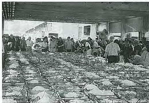
但馬の各浜は一層活気づきました