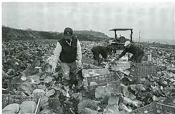
㈱ジェイエイファーム六甲でのオペレーター組織による農作業

JAでは、都市部の農業の衰退を食い止め、組合員を支援することを重要な使命の一つとしています。都市農業の振興を通じて、将来JAの基盤となる組合員へ農地が継承されるよう、今後も取り組みを強化します。