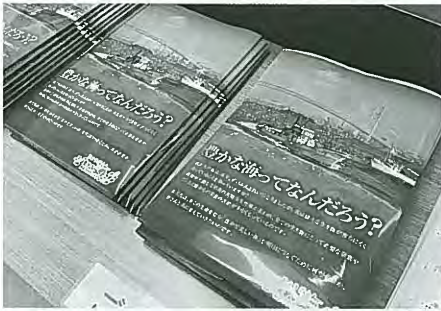
学習ブースの資料

普段はセリを待つ活魚が入る生簀(通称プール)で魚と一緒に水遊び体験や、鮮魚をはじめタコやアナゴの天ぷらを販売する飲食エリア、海の生き物の生態系などを学ぶコーナーなど多彩なブースのほか、船に乗って、明石海峡の漁場調査を体験するイベントも行われました。 学習ブースでは、食物連鎖を支えるプランクトンの餌となるリンや窒素といった栄養まで少なくなったこ