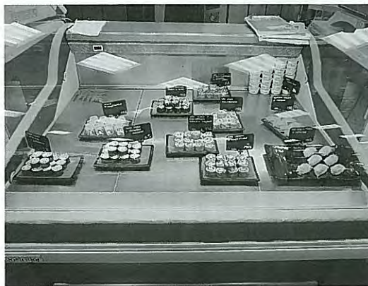
寿司はロール系が多い

員が配置され、大型カバンは無料ロッカーに預ける必要があるなどセキュリティが厳しく、買い物を終えたあとの買い物を終えたあとの厳しいチェックがありました。店内はあらゆる食料品が揃い、キャビアといった高級食材や寿司も販売されていました。