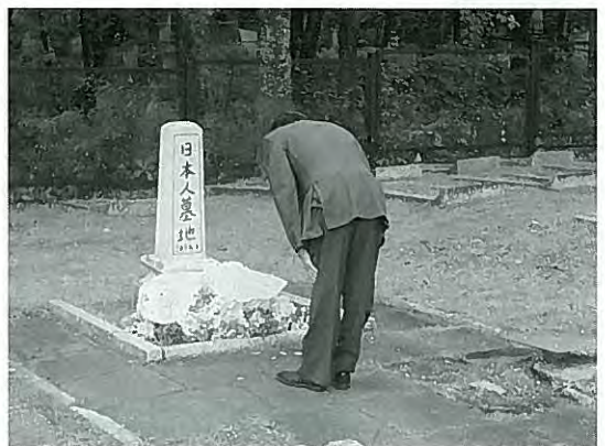
献花する東根団長