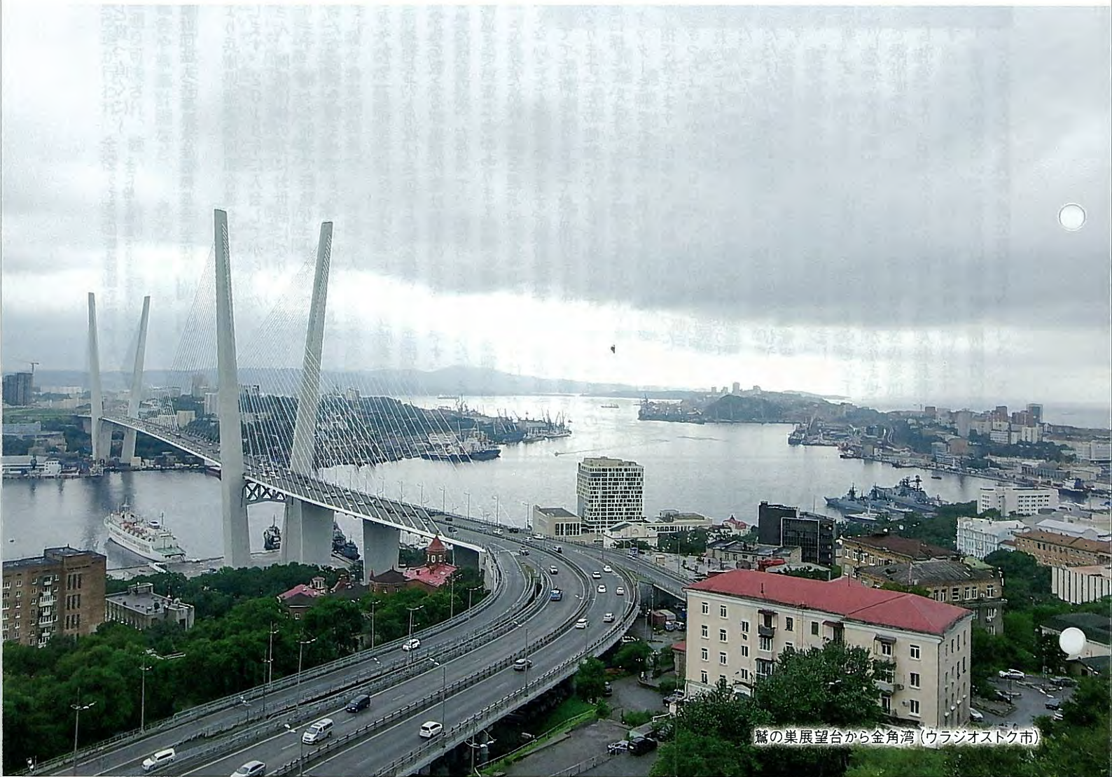
鷺の巣展望台から金角湾 (ウラジオストク市)