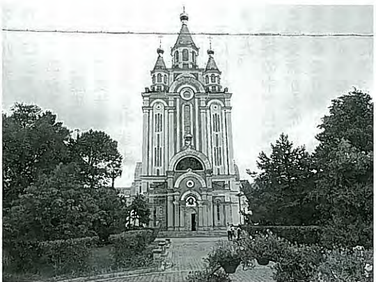
ウスペンスキー教会

日本に帰還することを果たせずシベリアで望郷の念にかられながら亡くなられた方々に心より深く哀悼の意を捧げました。その後、ウスペンスキー教会・レーニン広場などを視察し、市内のレストランで日本語学習者とのラン