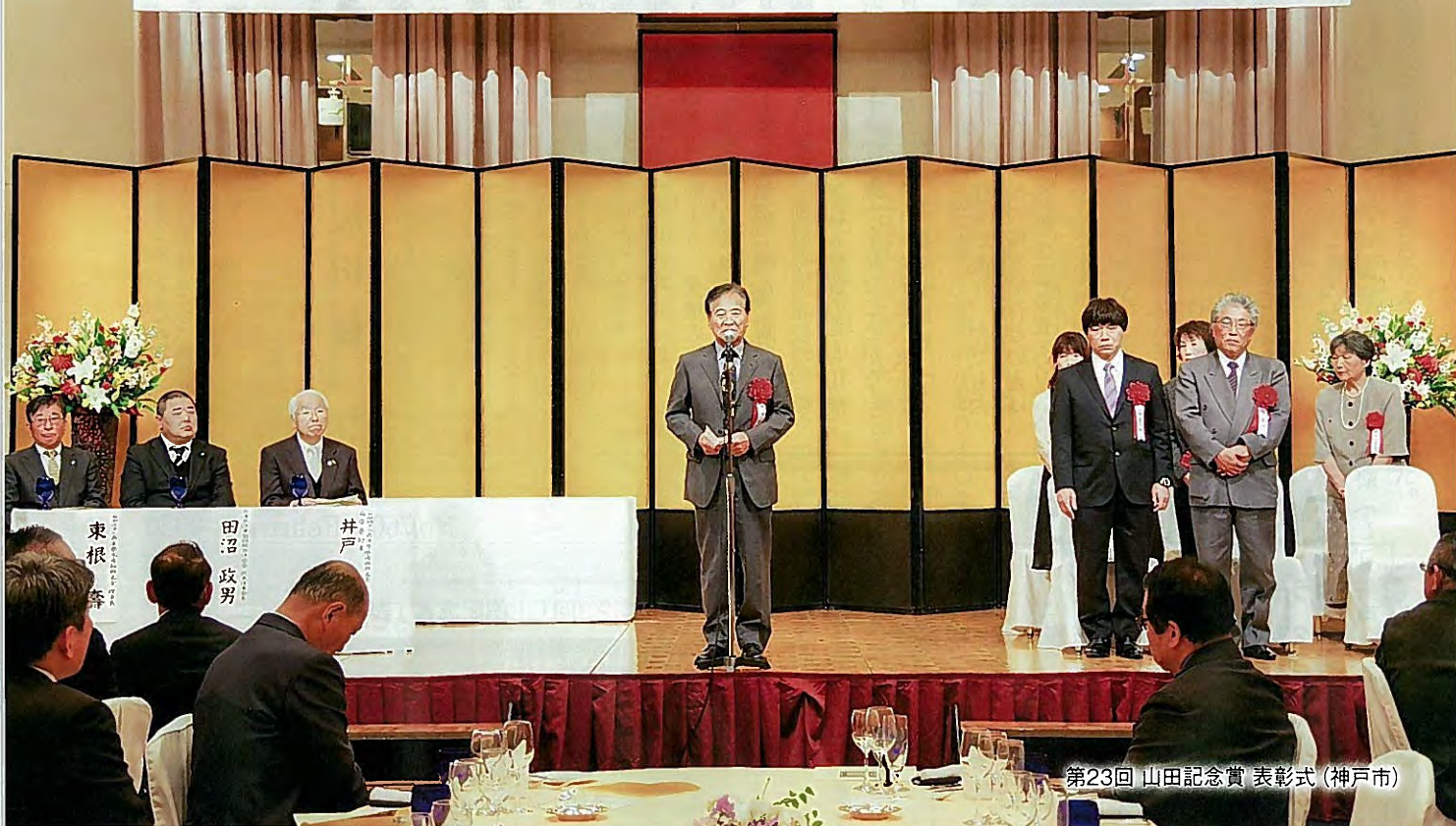
第23回 山田記念賞 表彰式 (神戸市)