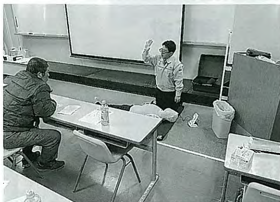
救急救命講習の様子