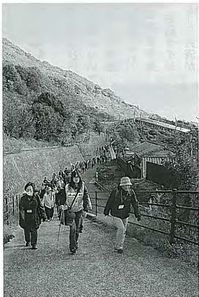
今年度のウォーキングの様子

JAでは今後も、地域の人々に楽しみと憩いの場を提供することで地域の活性化を図り、より多くの人々にJAファンになってもらうよう取り組みを進めていきます。