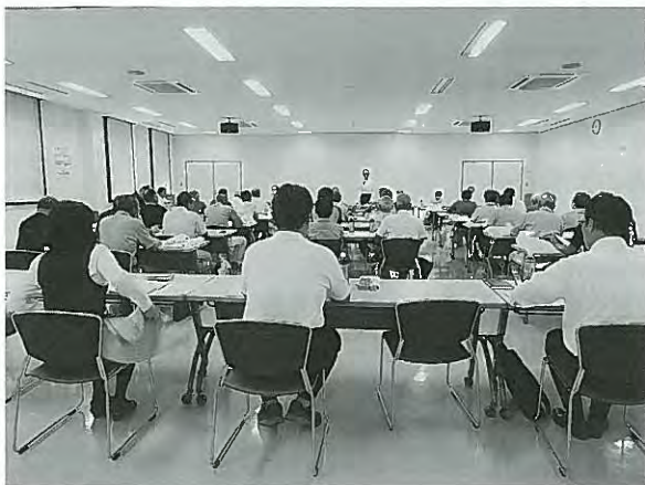
担い手農家懇談会の様子

今後も農家の所得向上に向けて、地域の農家に寄り添って、担い手の声を大事にした支援を行っています。