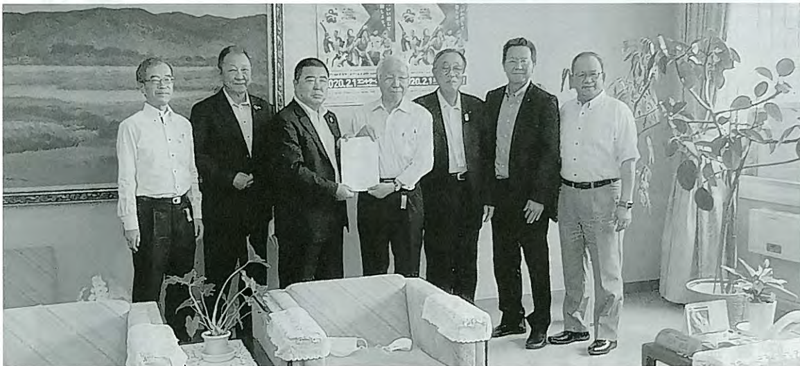
左から、金澤副知事、突々専務、田沼会長、井戸知事、永田会長、長岡議長、松本県会議員

この様な中、国においては、新型コロナウイルス感染症対策を柱とした2020年度第2次補正予算案が6月12日に可決成立するとともに、兵庫県においても6月17日に、県産水産物の学校給食提供や食育活動支援、県産水産物の販売促進、漁