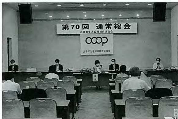
規模を縮小し開催

今年、兵庫県生協連は創立70周年を迎えます。「つながる力で未来をひらく～平和で持続可能な社会の実現～」を基本テーマとし、本総会で承認された活動を会員生協・団体とともにすすめてまいります。