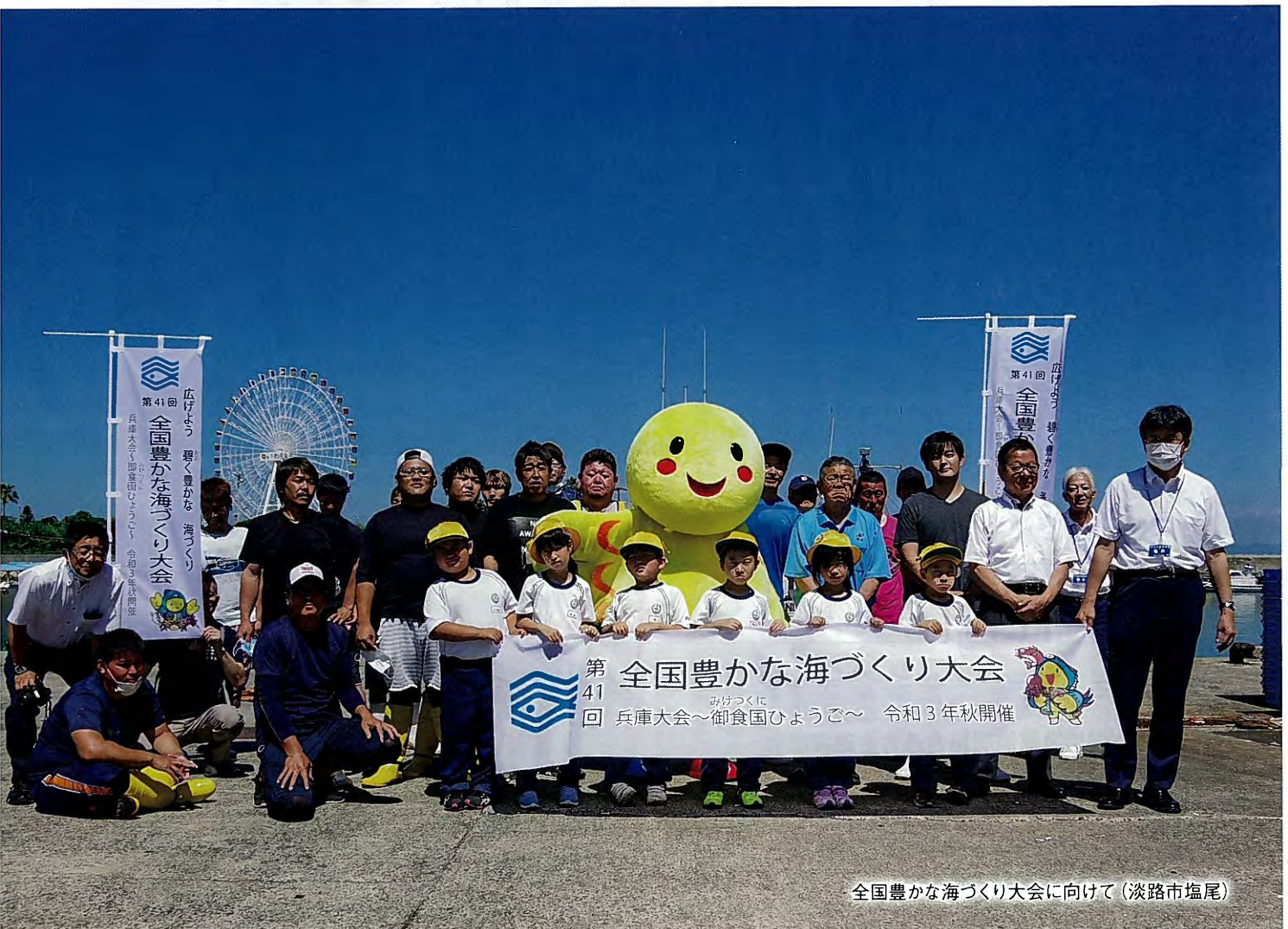
全国豊かな海づくり大会に向けて(淡路市塩尾)