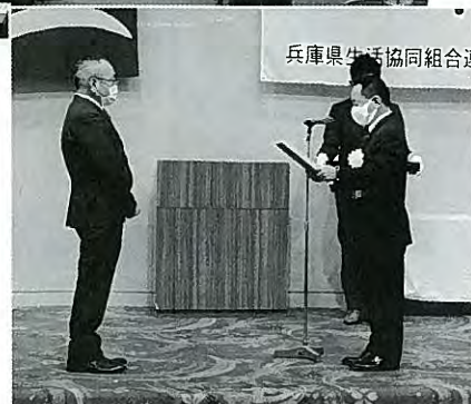
兵庫県生協連会長表彰