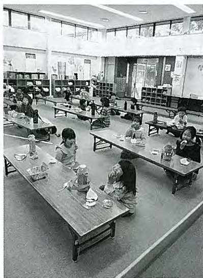
児童クラブでのびのびと過ごす児童たち

に感じてもらい、事業利用者を増やすきっかけになっています。学童保育を、地域ぐるみで子どもを育てるJAの活動として位置づけ、次世代とのつながり強化を目指しています。