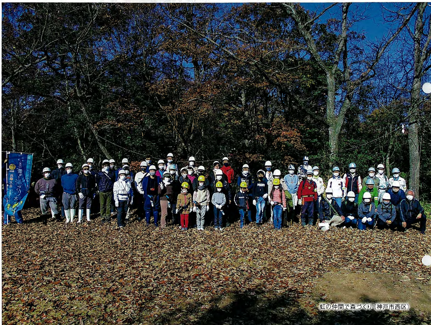
虹の仲間で森づくり (神戸市西区)