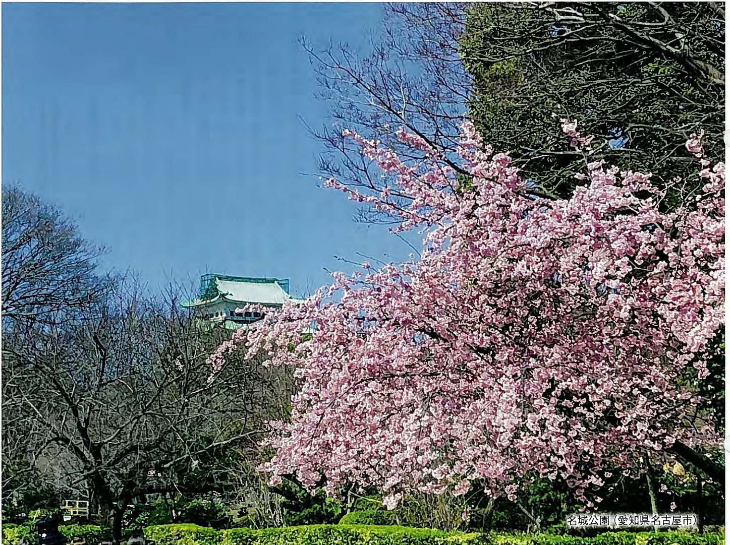
名城公園 (愛知県名古屋市)