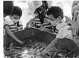
漁獲物の選別体験