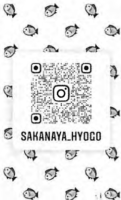
「Instagramフォロー」をお願いします！