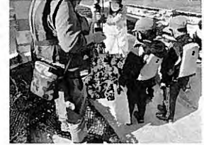
養殖カキ収穫体験