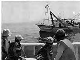
底びき網漁の見学