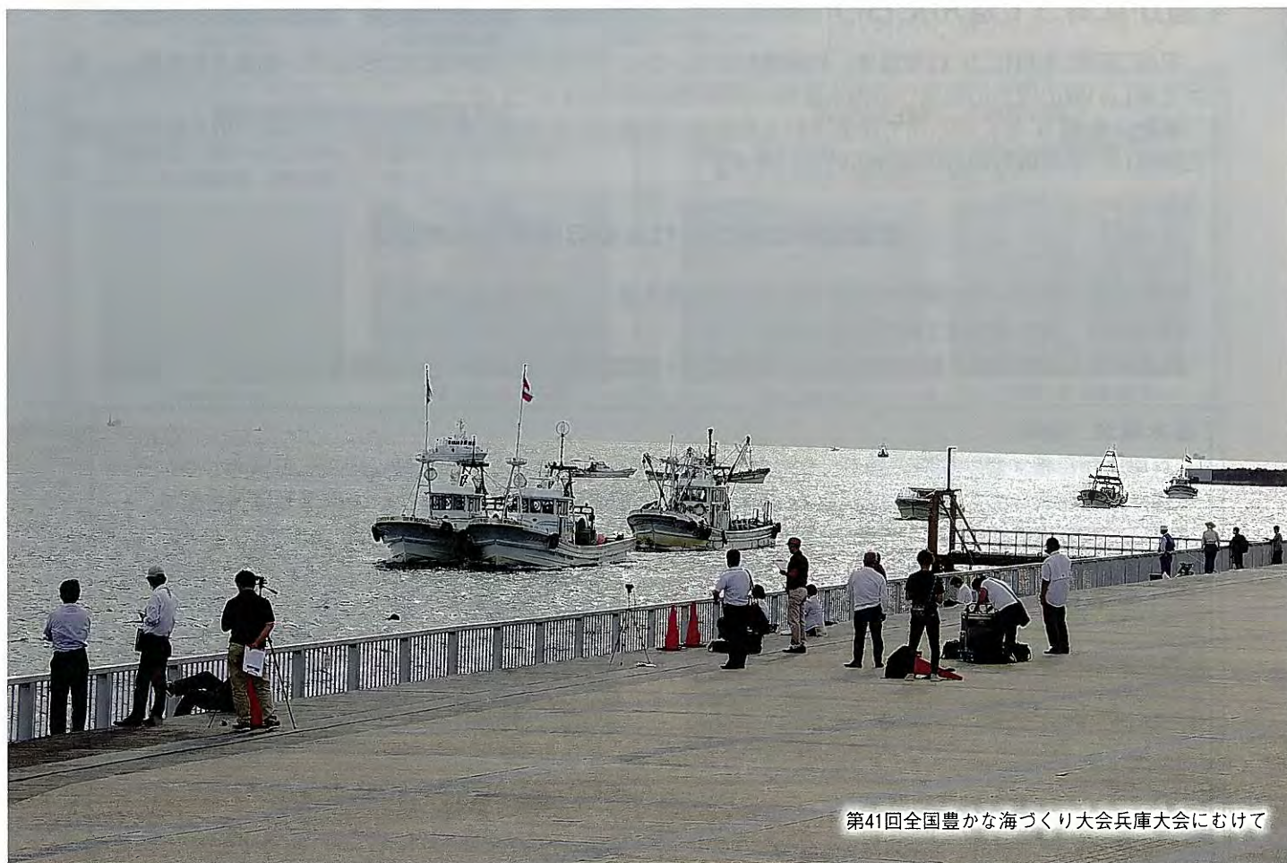
第41回全国豊かな海づくり大会兵庫大会にむけて