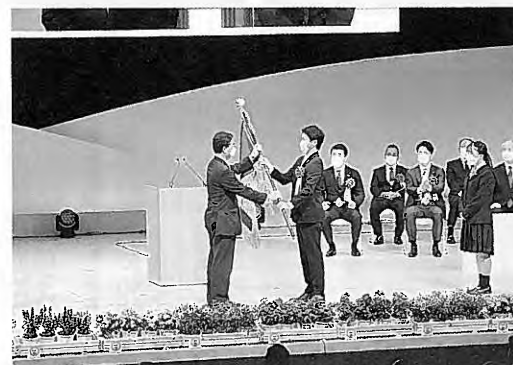
大会旗が齋藤知事に引き継がれる