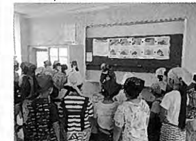
地魚の三枚おろしの実習