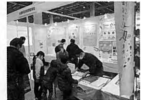
フィッシングショー OSAKA