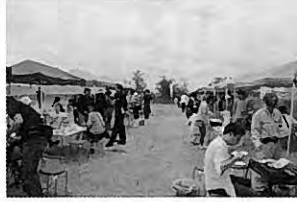
地魚バーベキュー