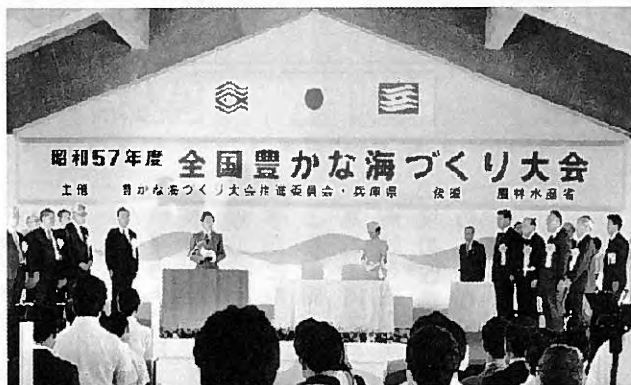
お言葉を述べられる皇太子殿下