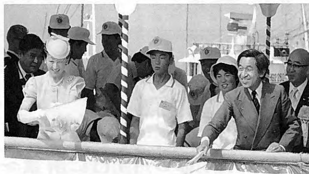
御召船から御放流される皇太子同妃両殿下