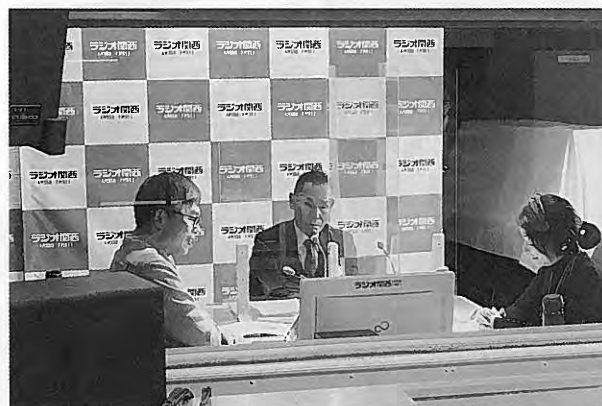
収録の様子(小磯組合長)