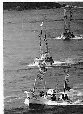
放流会場に向かう参加船