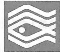
大会シンボルマーク

水産資源の維持培養と海の環境保全に対する意識の高揚を図るとともに、水産業に対する認識を深めるための幅広い国民的行事です。