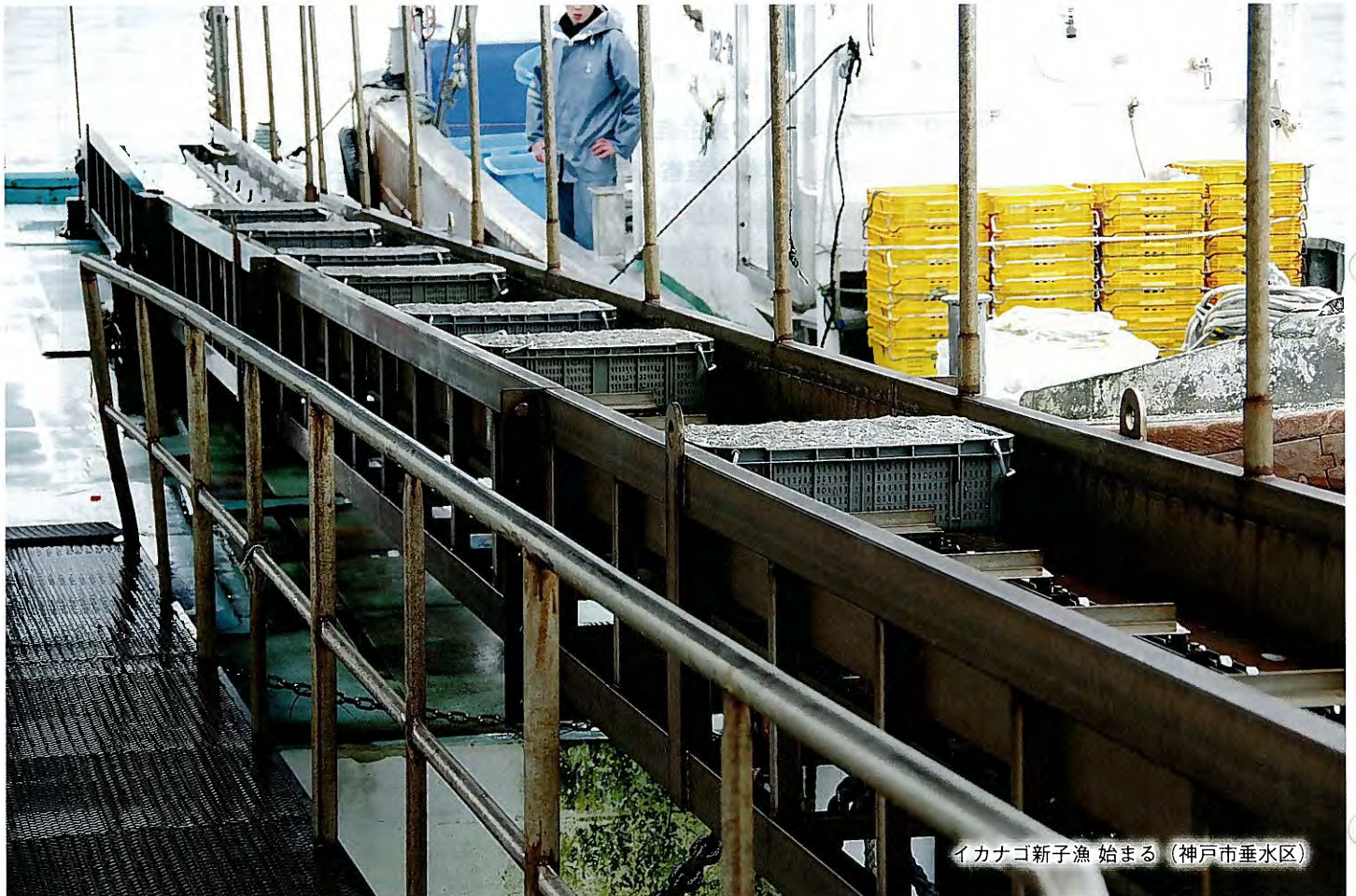
イカナゴ新子漁 始まる (神戸市垂水区)